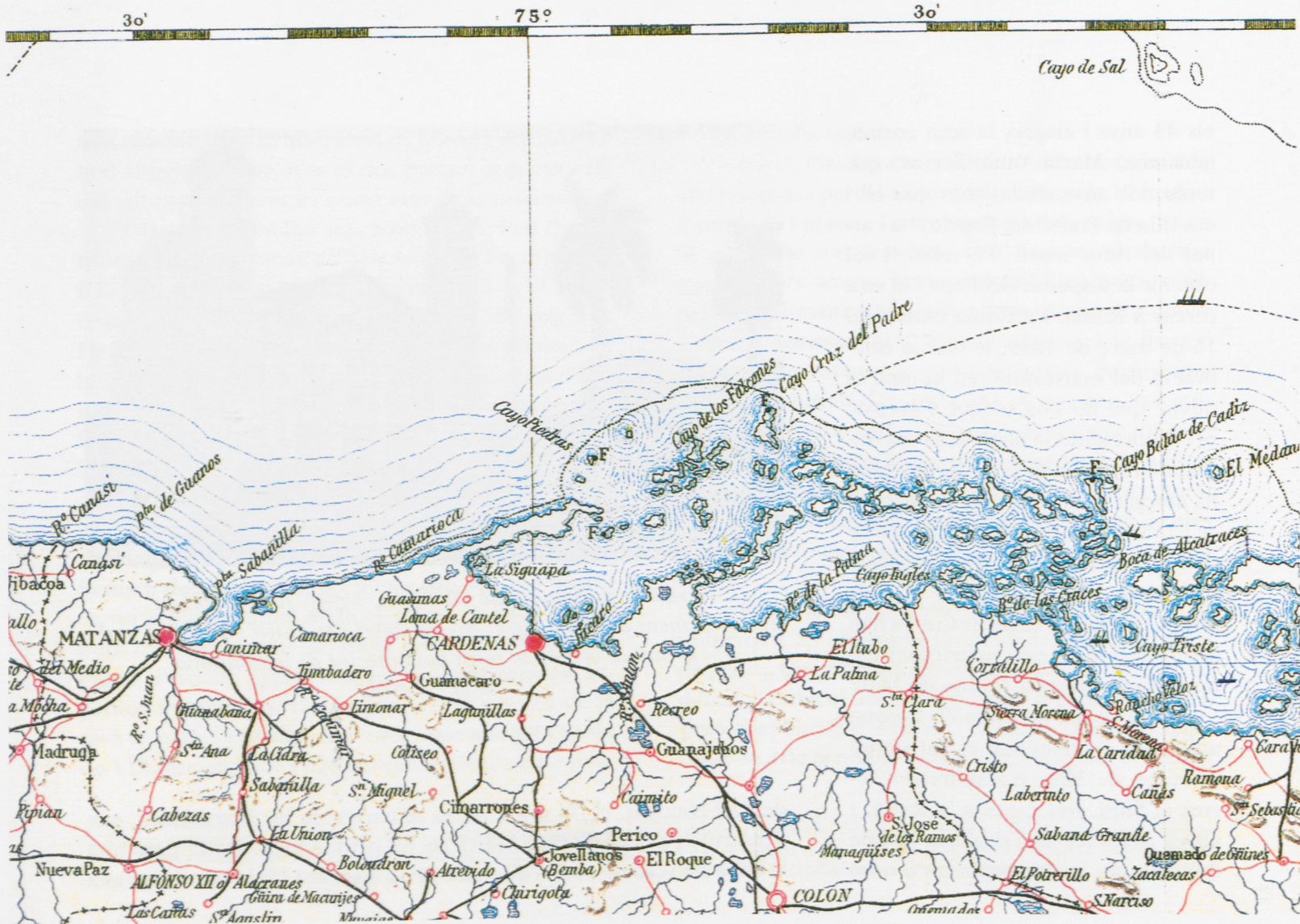
Fragment d'un mapa de l'illa de Cuba a l'any 1896, dos anys abans de la seva independència. Centrat a Càrdenas i la seva badia, comprèn des de Matanzas a la costa dels Caios.