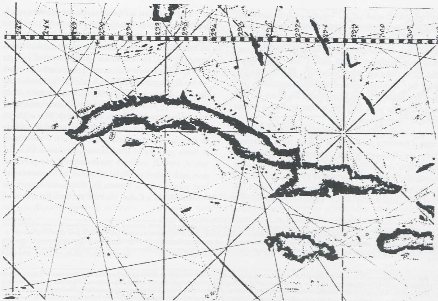
L'illa de Cuba en una carta nàutica manuscrita a l'entorn de l'any 1700.