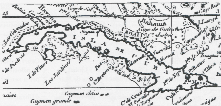
Cuba en una carta de navegar de l'any 1813.

La construcció naval, tan estesa i arrelada en la costa de Llevant, cada vegada més necessi-