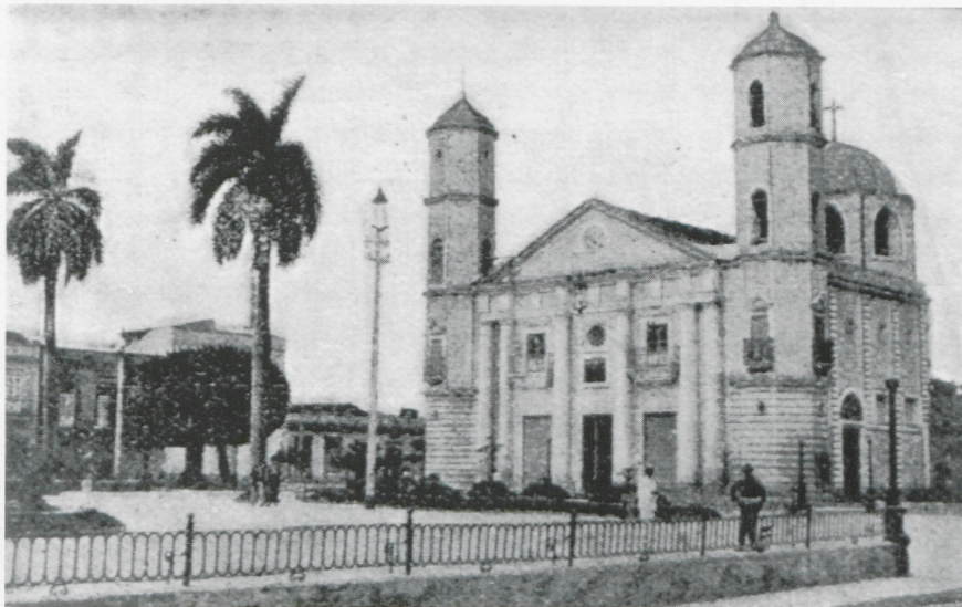
L'església parroquial de Càrdenas, segons una postal de començament d'aquest segle. No ha sofert cap canvi en relació amb la que es veu en la vista panoràmica de la litografia de la coberta.

Els rèdits de Cuba els anaven aplicant a incrementar el patrimoni d'Arenys de Mar. S'adquireixen terres al Sapí, tres cases a la Riera, i altres al carrer de l'Església i al de Sant Narcís, que es registren a nom