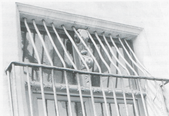
Detall de fusteria barroca en finestres de Can Ramis.