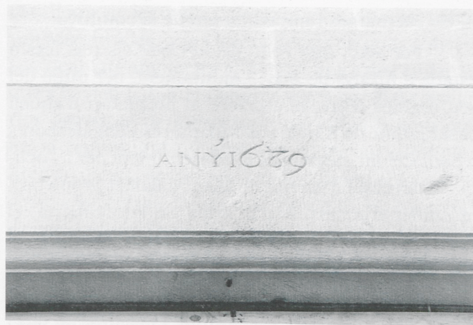
Llinda de balcó de la casa Milans-Ramis amb la data de 1689 per procedir de la vella casa Morell.

amb l'existència la veïna Casa d'En Cabirol, a la mateixa línia de façana de la Riera, també del mateix nombre de plantes i d'indèntiques alçades de les de Can Milans (Ramis) que, després de l'obertura prèvia de passos entre una i altra casa, donaven un conjunt de superfície habitable de 617 metres quadrats a cada una de les tres plantes. Altrament als 612 metres quadrats del pati de Can Milans (Ramis) calia aleshores sumar-hi altres 1.101 metres quadrats dels patis de Can Cabirol que, tenint sortida al carrer d'Avall, eren un lloc molt adequat per a tenir-