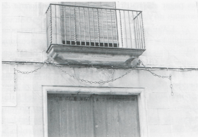
Les tradicionals cadenes pròpies d'on han habitat els monarques, llueixen sobre la portalada de la casa Milans-Ramis.

Tan sols va arribar a bon fi la mercè donada a l'Escola de Nàutica, que tot seguit va avantposar al seu nom el títol de Real . El privilegi -i aleshores era certament un privilegi poder fer us de la bandera de guerra de la Reial Armada- donat de paraula el 22 d'octubre de 1802, no es va posar per escrit fins al juliol de 1804(48).