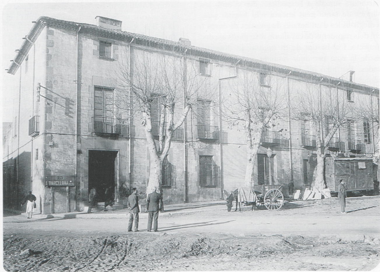
La casa Milans-Ramis a l'any 1945